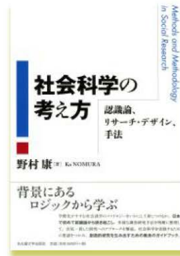
Right: Textbook on research methodology