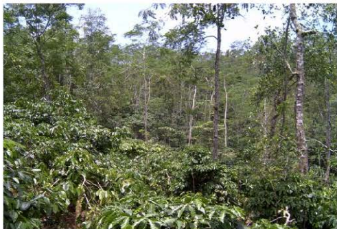
Left: Agroforestry in Central Java, Indonesia