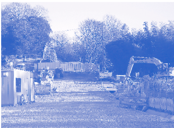
緑地西側に沿う第2環状線の下山畑信号から東の工事現場 (1月2日)

ところが、2000年の春以来事態は一変し、周辺住民がまさかと思っていた都市計画道路の建設計画が突如浮上してきた。実は、市側が94年の2月以降に事実上秘密裏に進めていた道路建設に必要な用地買収がほぼ完了