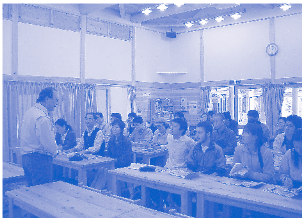
フィールドスタディでおこなわれたトヨタの森での講義風景

残りの問題は集客でした。できるだけ多くの学生に聞かせたいというのがサンワ側からの厳しい(?)注文でした。幸いにも、愛知県内国公立大学の単位互換制度が発足しており、これを利用させてもらうことにしました。初年度はまだ地下鉄が開通していなかったもので、授業の合間をぬって通ってくるのは大変だろうと思っていましたが、中京大学、名城大学、南山大学、名古屋商科大学