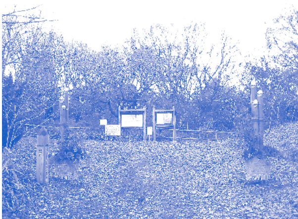
門松が飾られた「オアシスの森」入口。今年は緑地破壊が本格化する凶年になるか？（2005年1月1日撮影）

緑地保護を求める多数の住民の声を無視して建設工事が今まさに開始された弥富相生山線は、天白町が名古屋