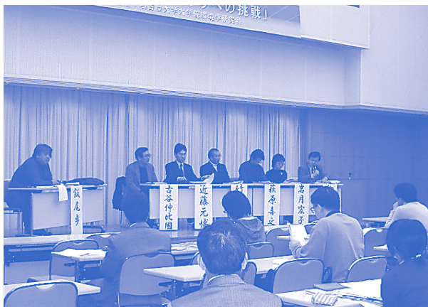
公開シンポジウム「循環型社会への挑戦」におけるパネルディスカッション

となりましたが、教室の前のほうに座り、質疑応答にも積極的に参加している様子は、学生にも刺激になっていると思います。やはり市民の人たちは意欲があるなあ、というのが私の個人的な感想です。学生さんにも期待！