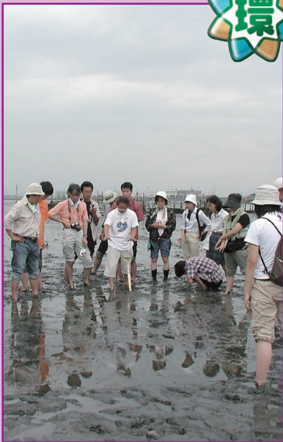
藤前干潟にて