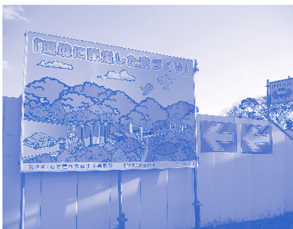
環境破壊の免罪符と化した決まり言葉「環境に配慮した」 (1月2日)

しかし、この専門家会の構成と運営には以下のようないくつかの疑問がある。(つづく)