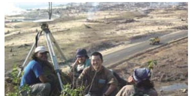
津波被災の直後、バンダアチエ西海岸(2005年3月) 後ろは集落だったのに。

1948年岐阜県生まれ。20年前、初の外国だったスマトラに、2004年スマトラ地震津波後、頻繁に訪れる。超巨大地震の発生から次の地震の準備過程をとらえてみたい。