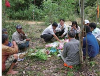
フィールド調査中の昼食風景