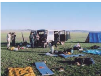
現地地質調査で野営の準備をする調査隊。日中の気温はモンゴル中央部では40度を、南部ゴビ地域では50度を超える。