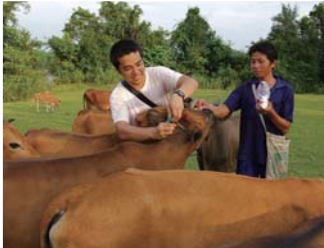
ウシの行動調査のためのGPS取り付け

2010年8月にGCOE「地球学から基礎・臨床環境学への展開」のORITとして、ラオス中部の世帯数104戸の小さな村に教員PD、博士課程の学生らとともに調査に入った。現地でのパートナーは、県と郡の農林局、そしてラオス国立農林業研究所(NAFRI)。ラオスのような国で共同研究をすすめるには、政府機関の協力が不可欠だ。また今回は、日本企業がユーカリの植林を実施している村が調査地なので、現地の企業担当者にも様々な便宜を図ってもらった。