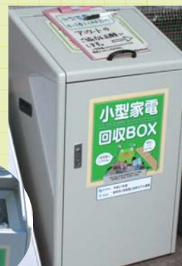
キャンパス内に2ヵ所設置された 「回収BOX」 ステッカーが目印