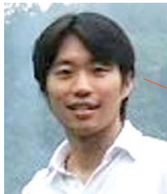
社会環境学専攻 環境法政論講座 准教授