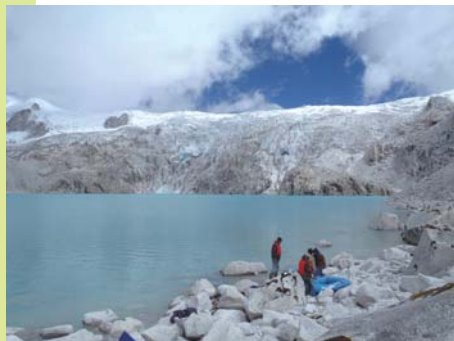
氷河湖の現地調査