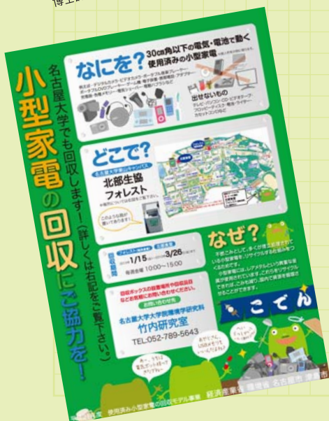
梁さんたちが、名大生にリサイクルを呼びかけるために つくったポスター

新鮮だったのは、自分の提案がみんなの力で実現したこと。「私の力でもできる。協力しようという気持ちがあれば人の意識や行動が変わる」。その経験を生かして、中国で環境教育やリサイクルのシステムづくりに取り組みたいと夢を描いている。