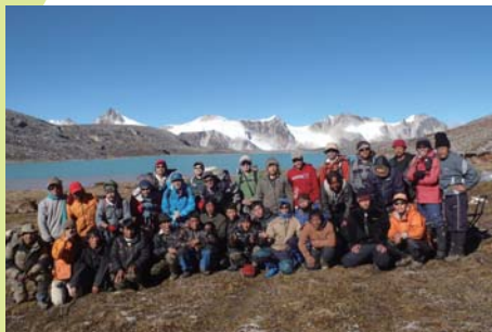
現地での記念撮影