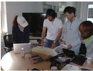
名大フィールドリサーチセンターで議論する名大・新潟大・モンゴル科技大合同調査チーム。

モンゴルの調査は日本のようにはいかない。夏期の約30日間、原野でのテント生活を余儀なくされる。食料はウランバートルで仕入れていくが、不足したら遊牧民から生きている羊を買って食料にすることもある。肉は毎日雑菌を殺すために火を入れるが、それでもにおいは日に日にひどくなり食欲は減退する。しかし食べないと体が持たないので、無理矢理でも口に運ぶ。毎年、必ず学生が体調を崩す。もちろん風呂はないし、昼夜30度の気温差は結構体にこたえる。苦難だらけだ。でも調査隊はみんな明るい。コーラシア形成史を明らかにするんだ」という夢を共有する仲間であり、彼らと苦難を共にすることは、むしろ快樂でさえある。私はこのプロジェクトを始めてよかったと思う。この仲間と共に、地質学上の大問題を解決できる日は決して遠くないと確信できるからだ。