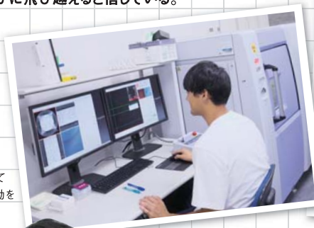
X線CT撮影によってレンガ中の水分移動を可視化

抱える研究プロジェクトも幅広く、学生は自分の研究テーマ以外に、そうしたプロジェクトにもかかわって刺激を受け、視野を広げる。「一番大事なのは研究計画がうまくいかなかったときに、もう一度組み立て直す力です。だから、学生の研究では、 失敗することも貴重な体験。失敗をどう取り戻すかを考えることができれば、そこから得られることは大きい 」。学生に求めるハードルは高い。けれども皆やる気を持って、軽やかに飛び越えると信じている。