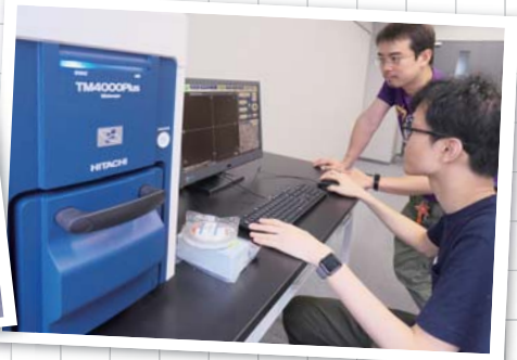
電子顕微鏡でセメントペーストの組織を分析