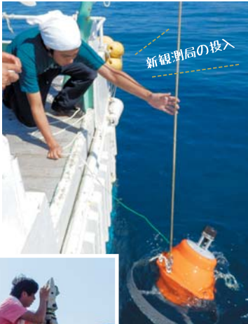
船に積装した観測機材 の測量

水深や水温、 電気伝導度を測る UCTD (Underway CTD) という機材による観測